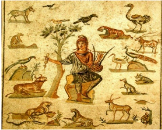
Orphée charmant les animaux au moyen de sa lyre. Musée archéologique de Palerme.