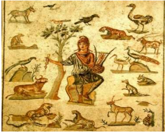
Orphée charmant les animaux au moyen de sa lyre. Musée archéologique de Palerme.