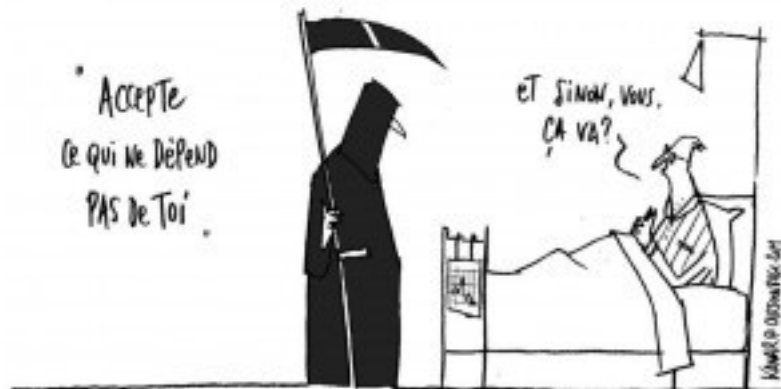
Représentation d'un concept stoïcien.

Les familles de tâches abordées en latin au 3 ème degré sont les mêmes qu'en 3 ème et 4 ème années, à savoir : traduire, commenter et étudier l'héritage antique .