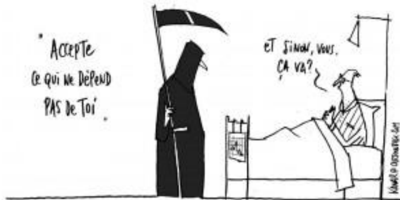
Représentation d'un concept stoïcien.

Les familles de tâches abordées en latin au 3 ème degré sont les mêmes qu'en 3 ème et 4 ème années, à savoir : traduire, commenter et étudier l'héritage antique .